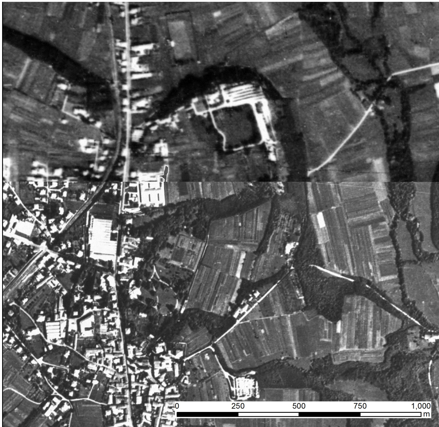
Immagine mosaicata delle foto Aeree Volo GAI (Gruppo Aereo Italiano) 1954-55