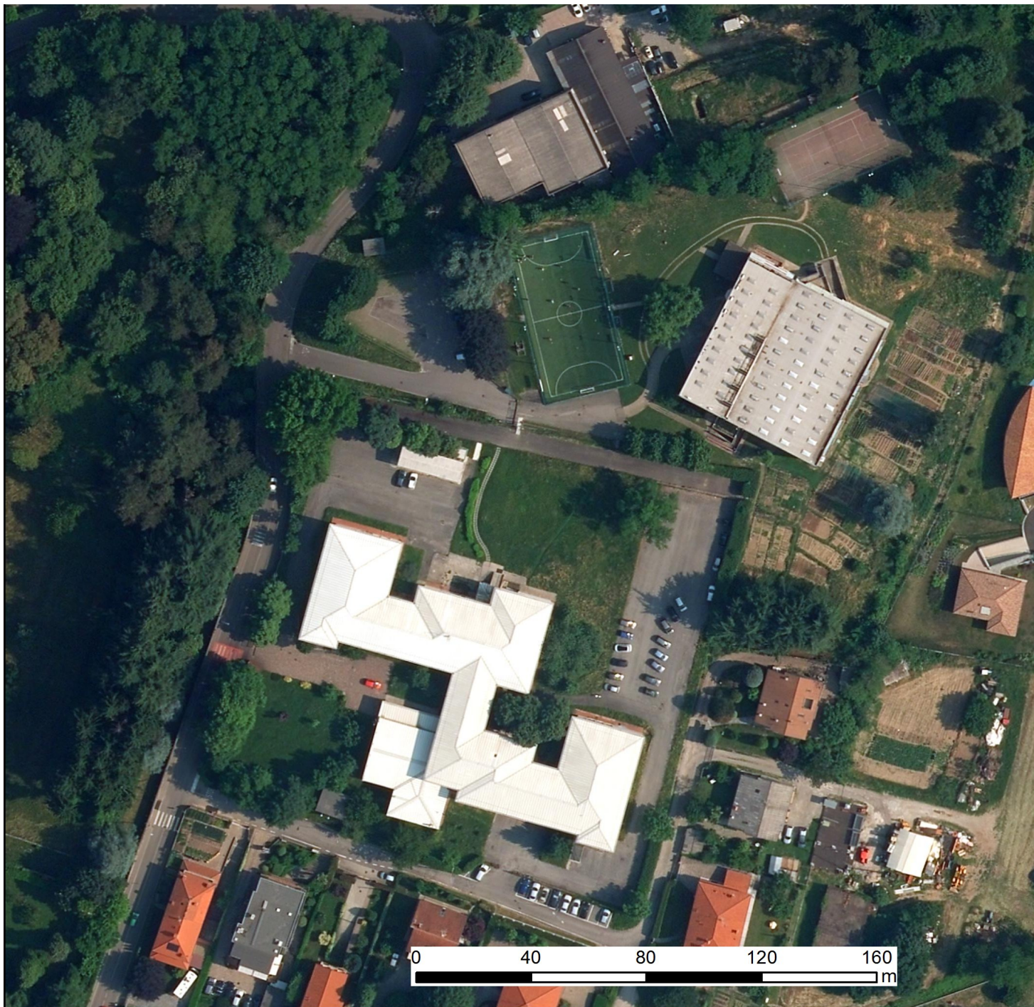
Ortofoto 2015 AGEA