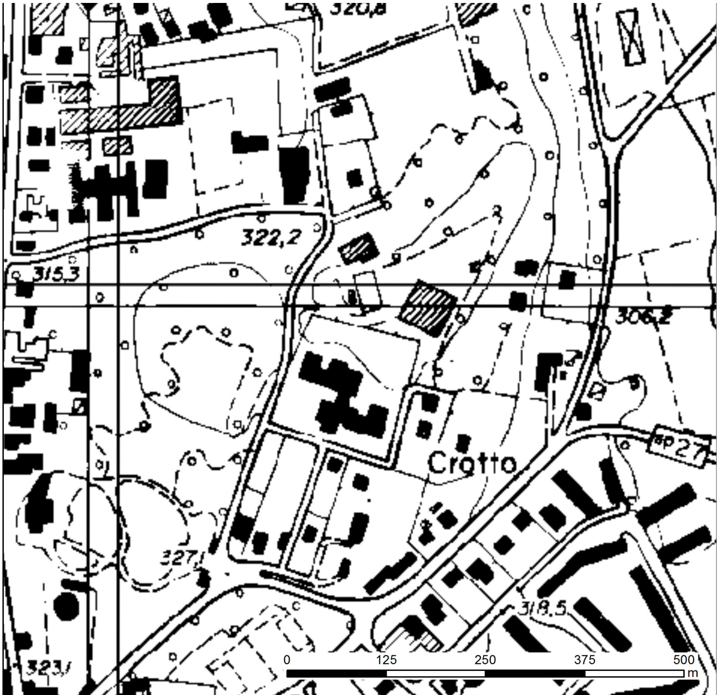
Carta Tecnica Regionale (aggiornata dai Database Topografici)